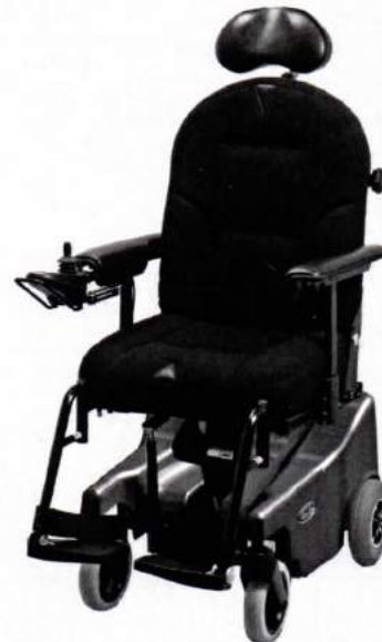
Blues 100 mit Komfortpolster

Den VELA Blues 100 gibt es mit Front- oder Heckantrieb, um den speziellen Anforderungen des Nutzers gerecht zu werden.