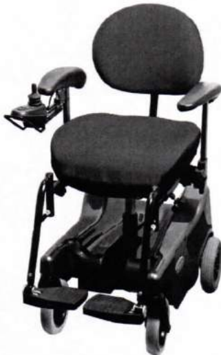
Blues 100 mit Heckantrieb

Den VELA Blues 100 gibt es mit Front- oder Heckantrieb, um den speziellen Anforderungen des Nutzers gerecht zu werden.